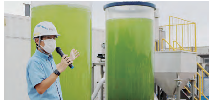
(微細藻類を培養する比較実験。発生した二酸化炭素を活用している右手の方が、培養の効率が良くなり、色が濃くなっている。)