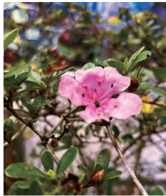
会場に飾られたセンカクツツジ