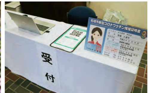
新型コロナウイルス感染症対策として、関係者のみでの開催とし、検温等の実施、受付では、ワクチン接種証明又は抗原検査等の陰性証明を確認。