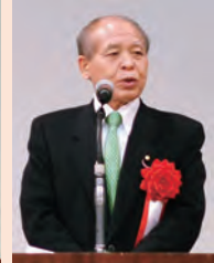
日本維新の会 国会議員団副代表 参議院議員 鈴木 宗男氏