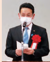
自由民主党 前外務大臣政務官 衆議院議員 國場 幸之助氏