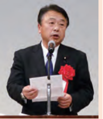
国民民主党 幹事長代理 衆議院議員 鈴木 義弘氏