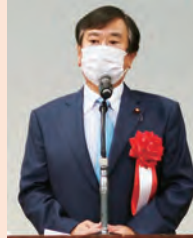
立憲民主党 衆議院議員 原口 一博氏