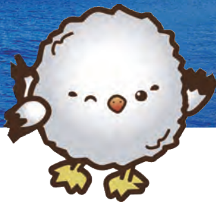
尖閣諸島イメージキャラクター アルバちゃん

尖閣諸島に関する基本的な情報（歴史や自然環境など）を解説パネル・歴史的史料・写真・3D模型・映像を使い、多くの人に正しく認識してもらう施設です。