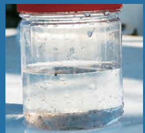
石垣島近海での海水やプランクトン採取の様子