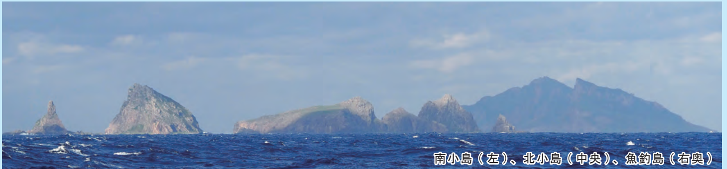
南小島（左）、北小島（中央）、魚釣島（右奥）