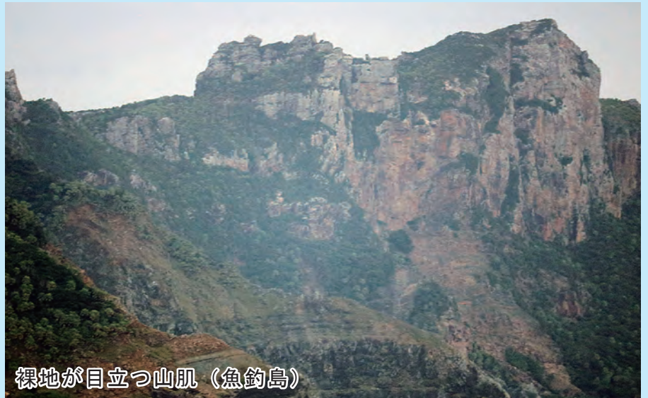
裸地が目立つ山肌（魚釣島）