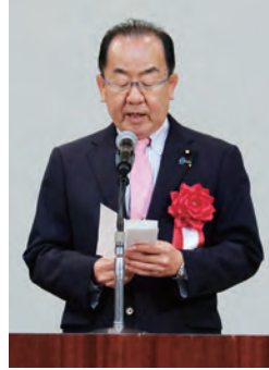
自由民主党 衆議院議員 西銘 恒三郎氏