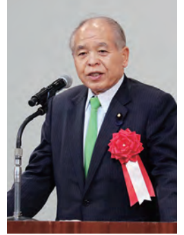
日本維新の会 参議院議員 鈴木 宗男氏