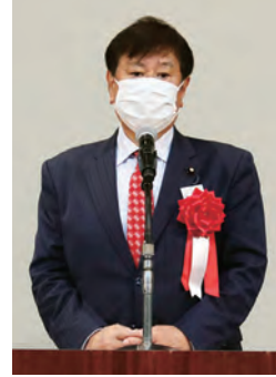
立憲民主党 衆議院議員 原口 一博氏