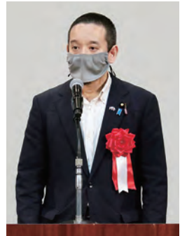
NHK党 参議院議員 浜田 聡氏