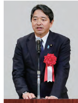
国民民主党 参議院議員 榛葉 賀津也氏