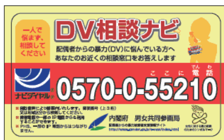
配偶者からの暴力の相談窓口の周知度

内閣府が平成20年度に実施した「男女間における暴力に関する調査」によると、男女とも役割が配偶者からの暴力について相談できる窓口を「知らない」と回答しています。