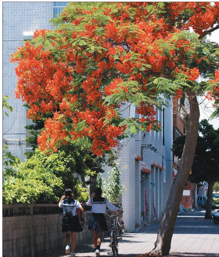
写真・陽だまりの花 仲里 啓

第1回花とみどりいっぱいフォトコンテスト入賞作品から 主催：石垣市民憲章推進協議会