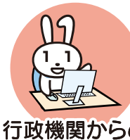
行政機関からの お知らせ・各種証明書