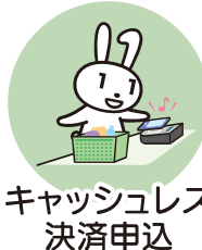
キャッシュレス 決済申込