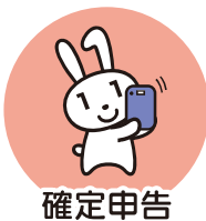
確定申告 (2024年度より)