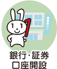
銀行・証券 口座開設