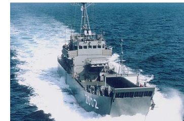
米LCUによる輸送（訓練準備）