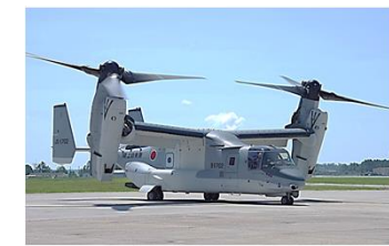
陸自V-22による物資輸送等