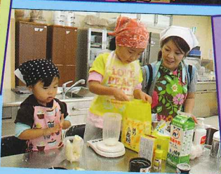
親子クッキング会