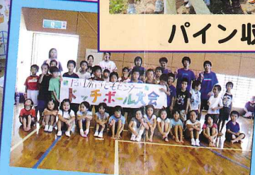
第1回ドッチボール大会