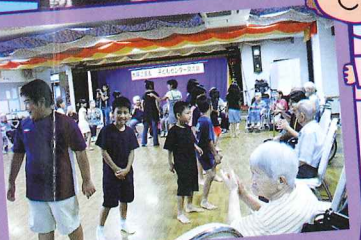
地域のお年寄りとの交流会