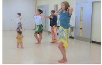
育児講座でタヒチアンダンス♪