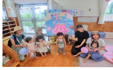
こっこーま 24 周年♡みんなでお祝いしました♡