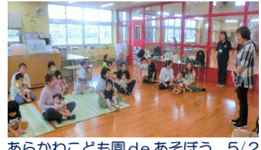
あらかわこども園 de あそぼう 5/23