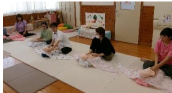
マタニティーカフェ