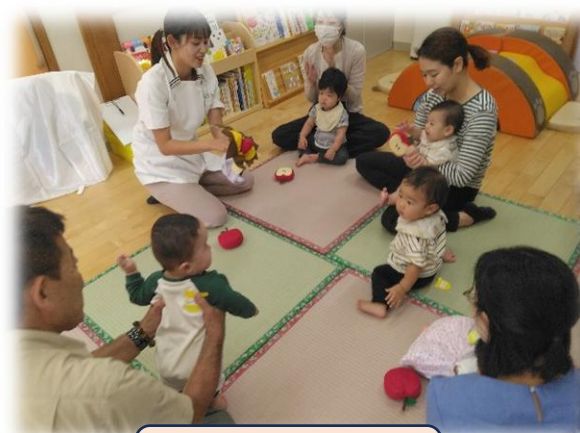
ファーストサイン