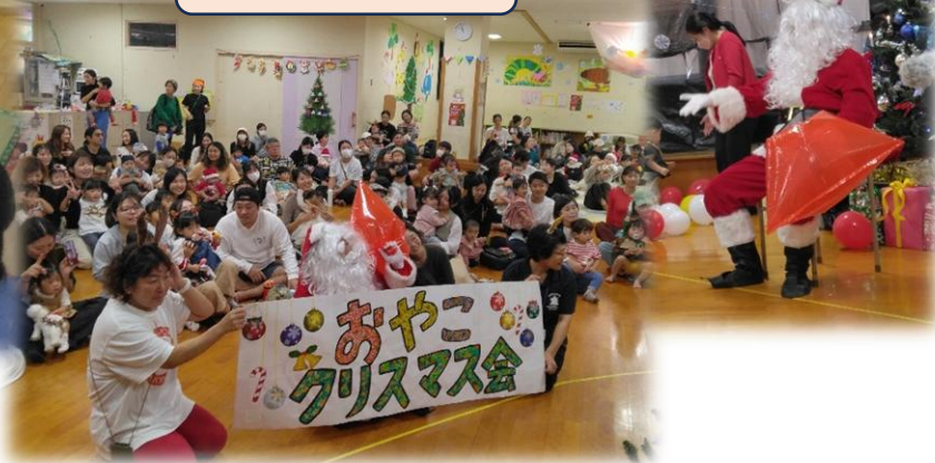
親子クリスマス会