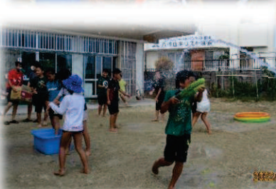
←ウォーターバトル