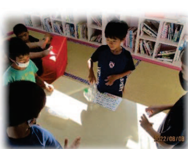
↑ギネス記録に挑戦! スーパーボール作り↓