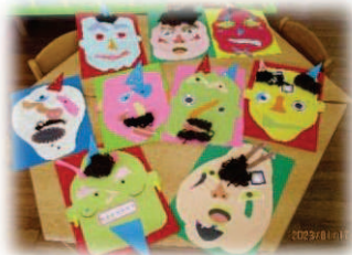
アートセラピーは 個性あふれるオニ制作