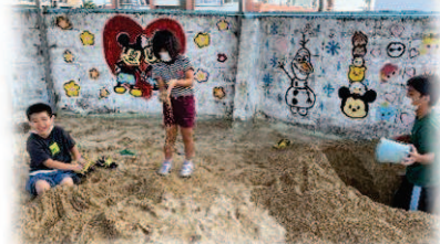
最近の流行りのあそびは砂場で大き な穴を掘りすっぽり入ること(笑)