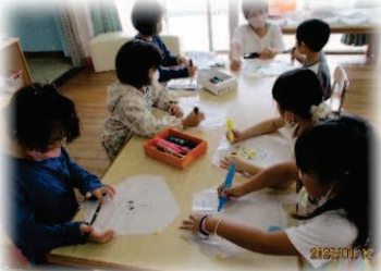
作ってあそぼうではお正月の 凧作り★園庭で飛ばしたよ