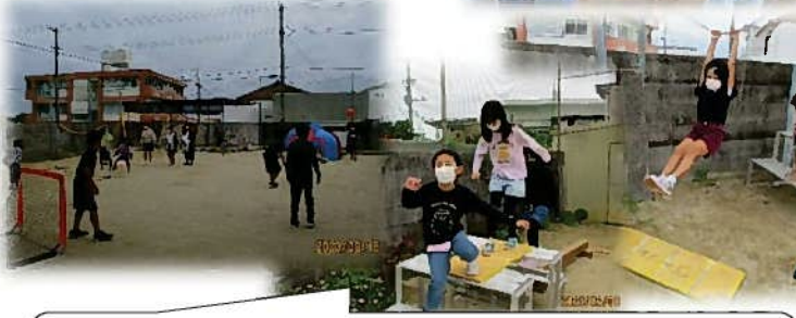
園庭にサッカー・バスケットゴールやアスレチックを設置 リップスティック、一輪車などもそろえて園庭が充実しました★