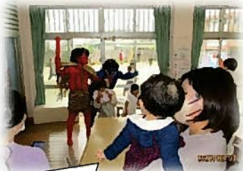
顔に似合わず優しいオニさんでした