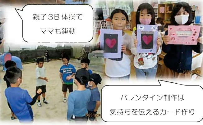
バレンタイン制作は 気持ちを伝えるカード作り