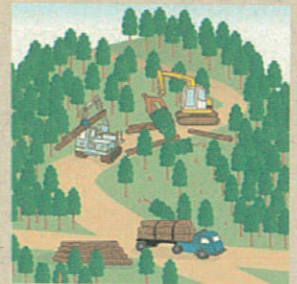
適切に森林整備を推進！

ことから、森林の土地の所有者の把握を進めるため、平成24年4月から森林法に基づく森林の土地の所有者となった旨の届出制度が創設されました。なお、この届出により、森林の土地の所有権の帰属が確定されるものではありません。