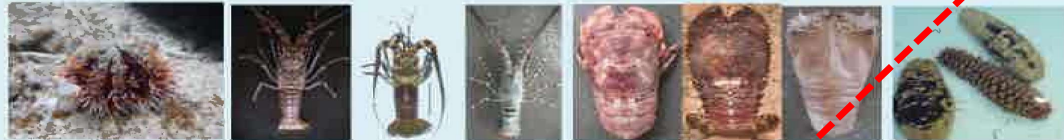
シラヒゲウニ イセエビ類 (全種) セミエビ・ソウリエビ類 (全種) ナマコ類 (全種)