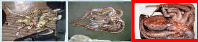
ワモンダコ (島だこ) シマダコ (しがやー) サメハダテナガダコ (しがやー)