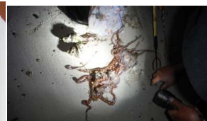
※密漁防止パトロール実施