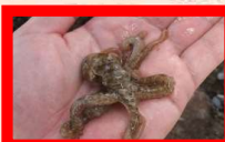
ウデナガカクレダコ