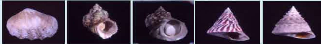
シャコガイ類 (全種) チョウセンサザエ ヤコウガイ サラサバテイ (たかせがい) ギンタカハマ (ひろせがい)