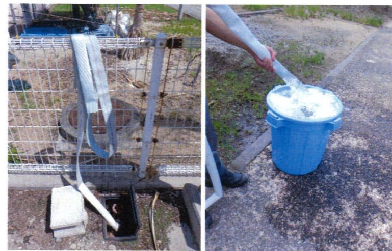
5 ホース 設置されているホースを 取水容器へ設置 ※運転時、ホース先が暴れるので注意