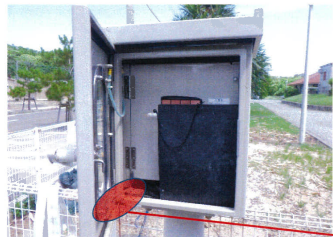
3 散水栓ポンプ操作盤