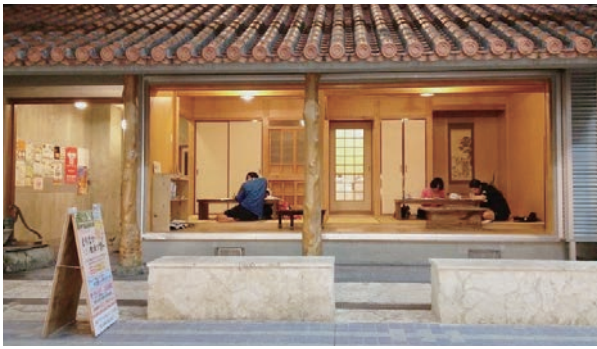
石垣市まちなか交流館ゆんたく家