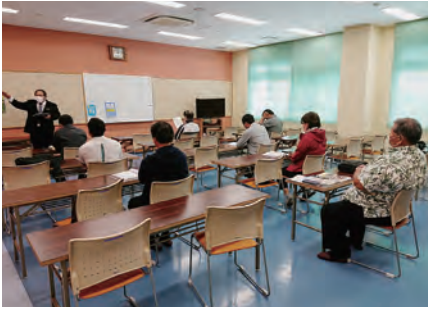
給食センターにて担当者から説明を受ける総務財政委員会

石垣市議会3常任委員会では、去る11月22日から11月25日の間、現地調査を含む所管事務調査を実施いたしました。