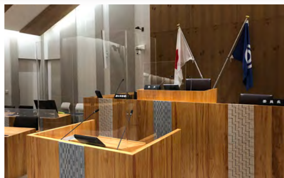
新型コロナウイルス感染症対策のため、アクリルパーテーション設置

新型コロナウイルス感染症対策 石垣市議会では、新型コロナウイルス感染症対策として、検温、マスクの着用、消毒液による手指消毒、本会議場等の換気の徹底、発言機会の多い本会議場の「議長席」「演壇」等にはアクリルパーテーションを設置するなど感染予防に取り組んでおります。 また、本会議を傍聴する方にも検温、手指消毒、マスクの着用等をお願いしております。ご理解、ご協力のご協力をお願いいたします。