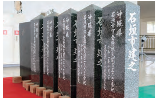
石垣市が製作した尖閣諸島の行政標柱

新たな行政標柱が作成されたことにより、市当局は令和3年9月3日に行政標柱設置の上陸申請を総務省に対し行ったが、令