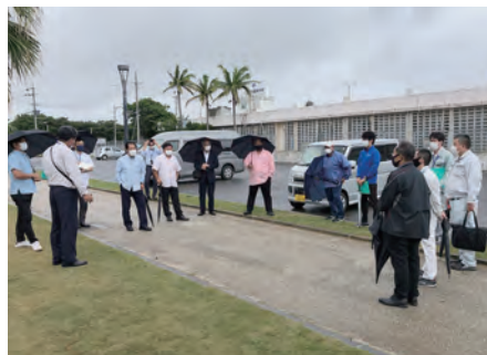
真栄里公園を視察した建設土木委員会

地調査を行い、担当職員から説明を受けるとともに関係者から意見・要望を聴取しました。また10日には当局から提出された資料をもとに事務調査を実施いたしました。