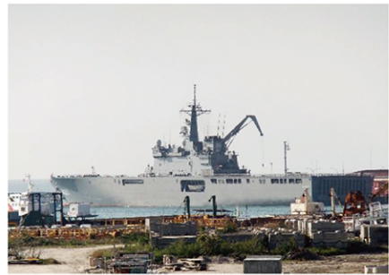
弾道ミサイル落下に備え、PAC3を積んだ自衛隊輸送艦が石垣港に入港した

2016年2月7日、北朝鮮はわが国をはじめ国際社会からの強い自制の申し入れにもかかわらず、国連安保理決議違反にあたる人工衛星と称する弾道ミサイル発射を強行した。北朝鮮が発射した事実上の弾道ミサイルの飛行コースは、当市を含む先島諸島上空を通過した2012年12月の発射とほぼ同じコースで、弾道ミサイル落下の危