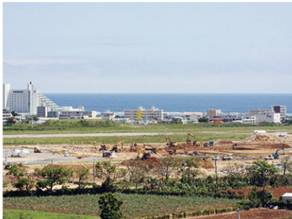
県立八重山病院の建設が進められている旧空港跡地

当該跡地は国、県、市有地私有地と土地所有者が混在しておりますが、なかでも当該跡地に国有地が多く散在するのは、終戦間際、土地代金の評価、物件補償、移転登記、代金の支払い方法等、地主との話し合いは