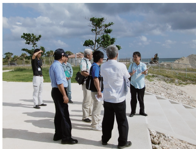
南ぬ浜人工ビーチについて説明を受ける建設土木委員会

経済民生委員会（大石行英委員長）は、11月14日に旧大浜町浄水場跡地や西海区水産研究所、八重山厚生園で現地調査を行い、担当職員から説明を受けるとともに関係者から意見・要望を聴取しました。また15日には事務調査を実施いたしました。