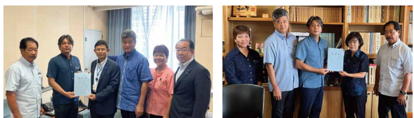
藤田水産庁次長と意見書の手交をする石垣市議団