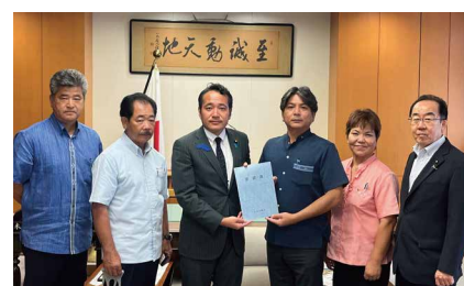
築文部科学副大臣と意見書の手交をする石垣市議団