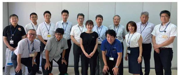
石垣島スポーツコミッションについて視察