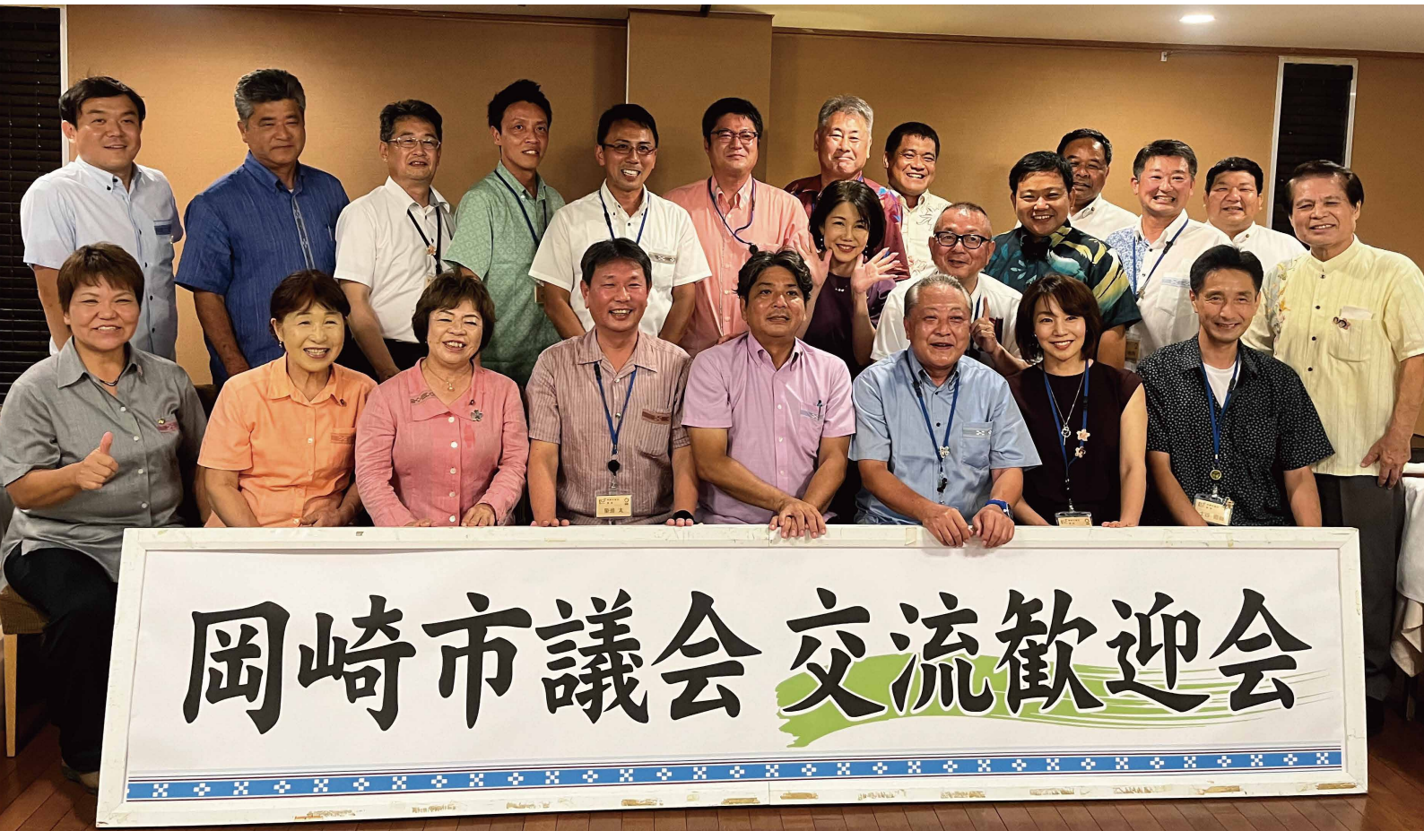
岡崎市議会と石垣市議会との交流の様子。