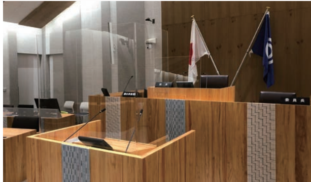
新型コロナウイルス感染症対策のため、アクリルパーテーション設置

感染症対策について 石垣市議会では、新型コロナウイルス感染症対策として、検温マスクの着用、消毒液による手指消毒、本会議場等の換気の徹底、発言機会の多い本会議場の「議長席」、「演壇」等にはアクリルパーテーションを設置するなど感染予防に取り組んでおります。 また、本会議を傍聴する方にも検温、手指消毒マスクの着用等をお願いしております。ご理解、ご協力をお願いします。