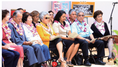
【写真上】平成25年にカウアイ郡で開催された議決50周年記念式典の様子。石垣市からカウアイ交流団「石垣市民の翼」のメンバーも参加しました。