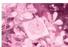
再進入防止対策の 誘殺板