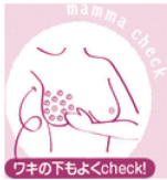
★触ってチェック ワキの下もよくcheck!