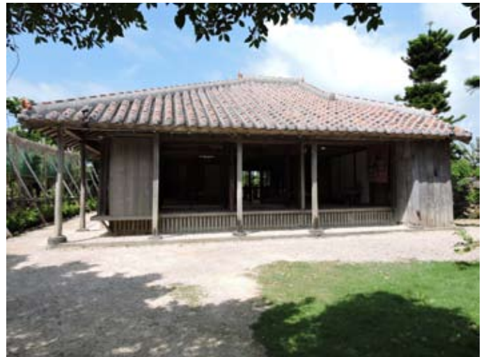
石垣やいま村旧喜舎場家住宅主屋