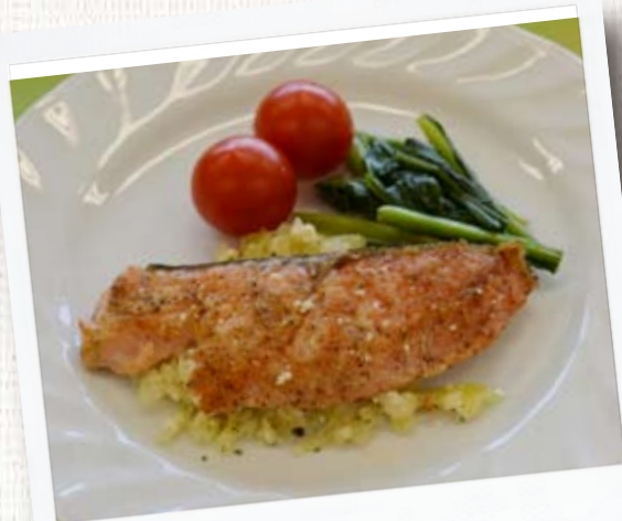
鮭のハーブソース

エネルギー 207kcal たんぱく質 10.2g 脂質 14.1g カルシウム 132mg 鉄 1.2mg 塩分 0.4g