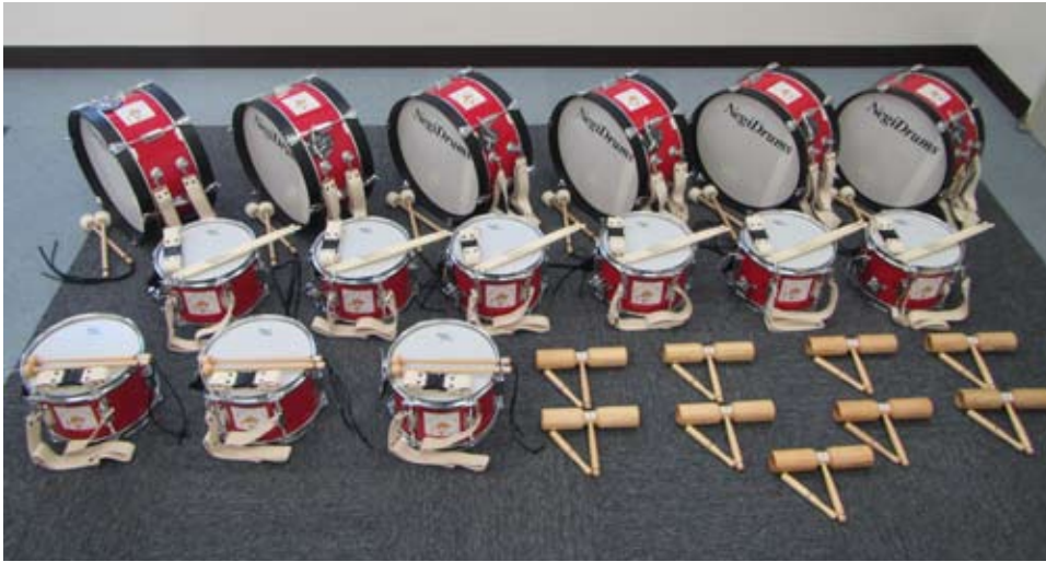
幼年消防用鼓笛隊セット

石垣市消防本部では財団法人自治センターの宝くじの社会貢献事業により幼年消防用鼓笛隊セットを購入いたしました。目的として、幼年消防クラブ育成事業の一環とし、火に対する正しい知識を身につけ、各家庭から火災の減少を図ること。また、将来、人命を尊重し、財産の保全を図る社会人としての素地を涵養することを目的とし、活用いたします。