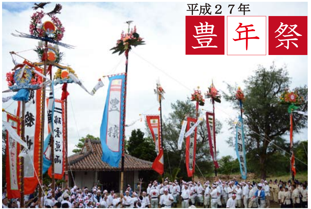
▲ 7月19日、大浜村の豊年祭。オーセで旗頭や中学生によるイリク太鼓、弥勒などを奉納し、最後には上村と下村に分かれて大綱引きが行われ、賑わいは最高潮に達しました。