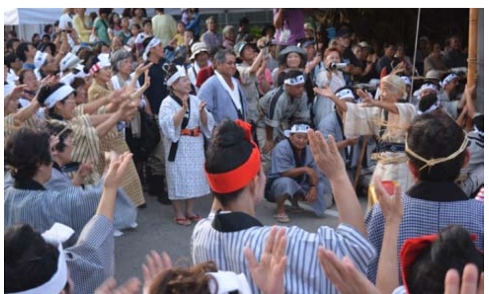
◀ ▲ 8月6日、四力字の豊年祭。真乙姥御嶽には四力字と各団体の旗頭が奉納され、その後女性のみによるアヒャー綱が元気よく行われ、会場は熱気に包まれました。