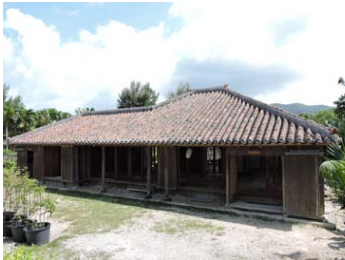
石垣やいま村旧大浜家住宅主屋