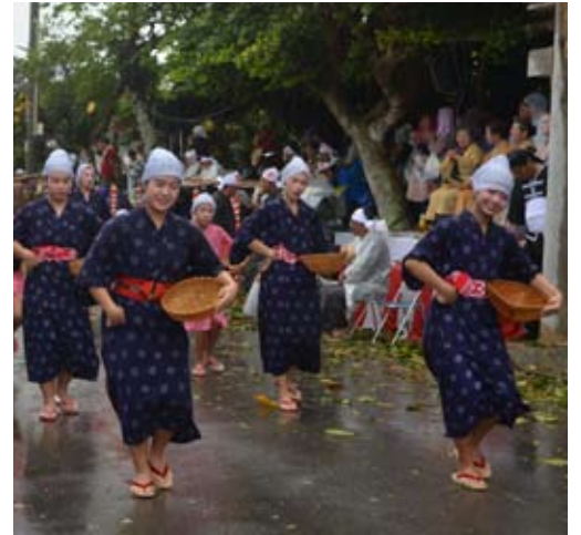
▲ 8月7日、白保村の豊年祭。苗植えや草取り、稲刈りや脱穀など白保ならではの「稲の一生」を奉納し悪天候にも負けずユニークに表現しました。