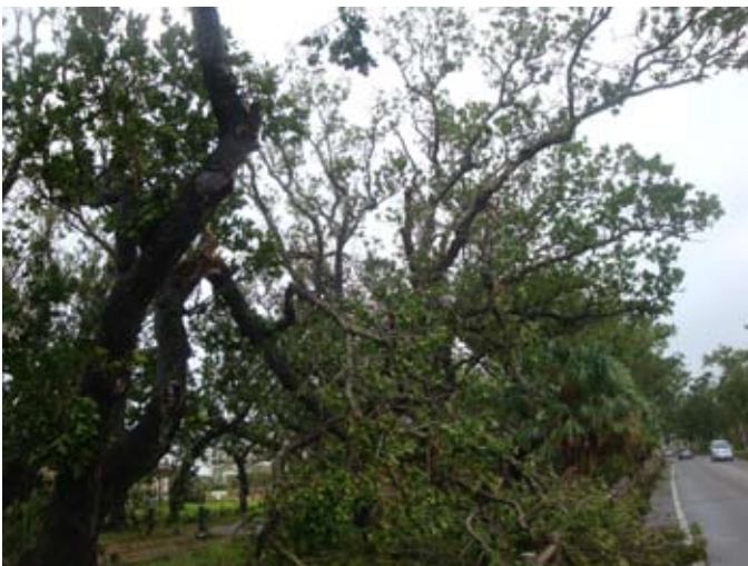
台風15号による宮良浜川原のヤラブ並木被害

相次いで石垣島を襲った台風15号と21号により、市内にある指定文化財も大きな被害を受けました。文化財課では15号の直後から危険性の除去を最優先に復旧作業を進めてきましたが、当該文化財の見学に訪れた皆様には、立ち入り制限などで多大なご迷惑もおかけしました。また、天然記念物の周辺では、倒木や大量の落葉も発生しましたが、ボランティア清掃により、これらを綺麗に蘇らせてくれた地域もあります。文化財の復旧作業・周辺清掃活動にご尽力いただいた皆様に対し、心より御礼申し上げます。今後も、地域の宝である文化財の保護活動にご協力くださいますよう、よろしく願いいたします。【お問い合わせ】 教育委員会文化財課 電話：0980-83-7269