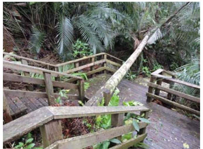
台風21号による米原のヤエヤマヤシ群落被害