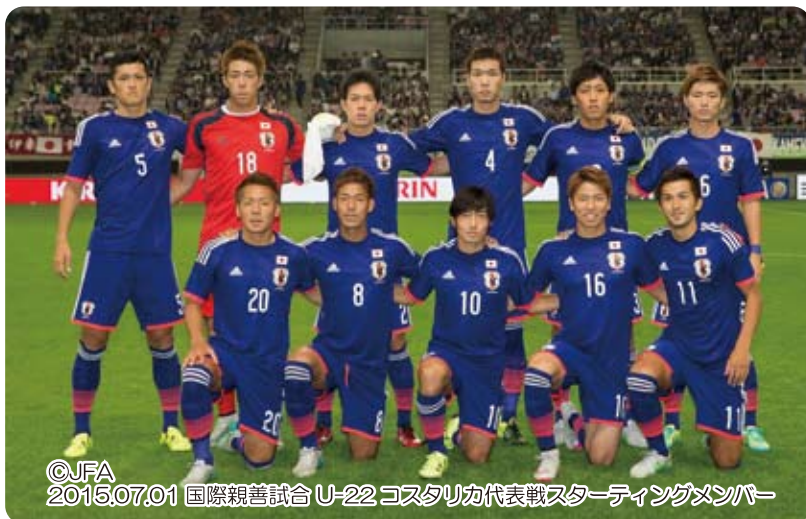
2015.07.01 国際親善試合 U-22 コスタリカ代表戦スターティングメンバー

来年のリオデジャネイロオリンピック出場を目指すU-22(22歳以下)日本代表が来年1月の最終予選(カタール)に向け、石垣市のサッカーパークあかんまにて強化合宿を実施することが決定しました。U-22日本代表の石垣島合宿は2004年のアテネオリンピック代表以来、2度目の実施となります。