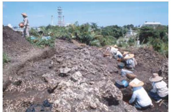
（石垣市新川ビロースク遺跡発掘1982年）