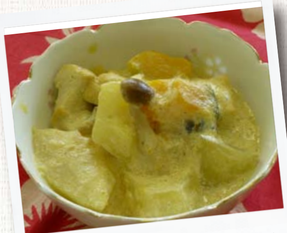
パパイヤと厚揚げのミルク煮

エネルギー 126kcal たんぱく質 6.4g 脂質 5.4g カルシウム 147mg 鉄 0.2mg 塩分 0.4g