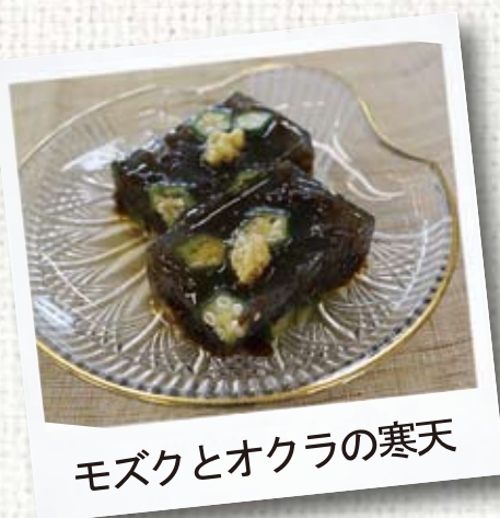
モズクとオクラの寒天

日々の健康はバランスの良い食事からと言われています。沖縄の野菜摂取量は約280gです。大人が1日に必要な野菜の量は350gですから、あと一皿(70g)程度の野菜が不足しています。意識して野菜を摂ることで理想的な食生活に近づきます。ことことを踏まえ、石垣生活改善推進員協議会では、無理なく島野菜がとれるように工夫し、冷蔵庫に常備菜として作り置きのできる「野菜レシピ集」を作成しました。今回は「野菜レシピ集」から献立を紹介します。