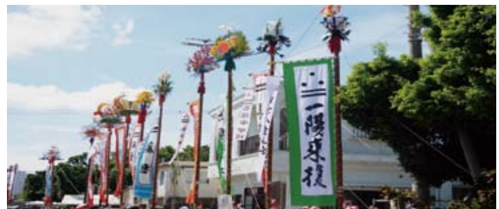
▲ 7月31日に新川にある真乙姥御嶽に四力字が集結。御嶽前の道路には各字や団体の旗頭が勢ぞろいし、女性たちによるアヒャー綱、ツナ又ミン、大綱引きと続き、会場は豊年祭独特の熱気に包まれました。