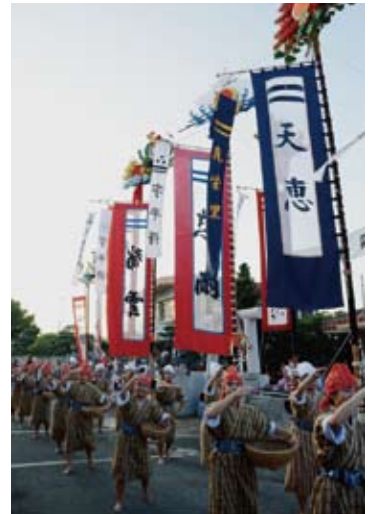
▲ 7月30日に行われた平得真栄里の豊年祭。平得婦人会による「平得世界報節」等の多彩な演目が続き、ガーリ、ツナ又ミン、最後に東西に分かれての大綱引きでは、西に軍配が上がりました。