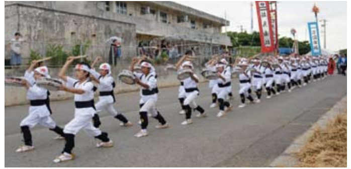
▲ 7月13日に行われた大浜村の豊年祭。旗頭の奉納、太鼓の奉納や弥勒奉納、各団体の余興行列が披露され、クライマックスは来場者全員での大綱引きが行われ、熱戦の末、上の村が勝利しました。