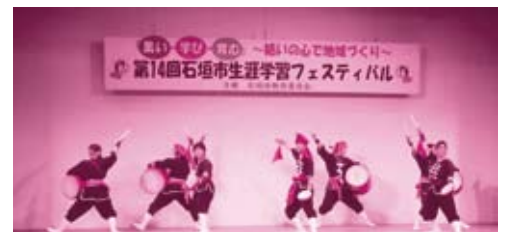
前回の生涯学習フェスティバルの様子