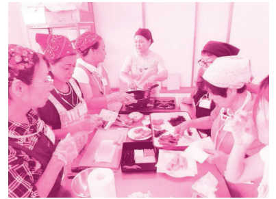
「ブルメリア学級」(成人学級)の重箱作りの様子