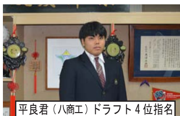
平良君（八商工）ドラフト4位指名