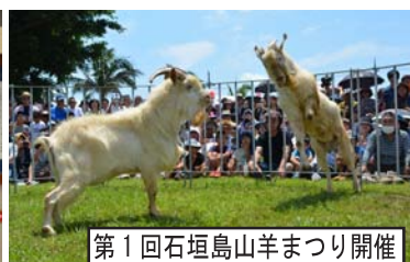
第1回石垣島山羊まつり開催