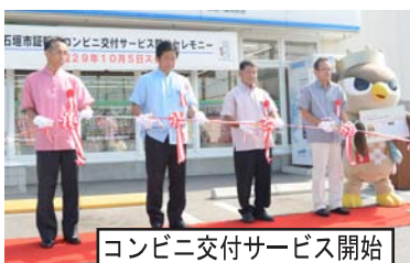
コンビニ交付サービス開始