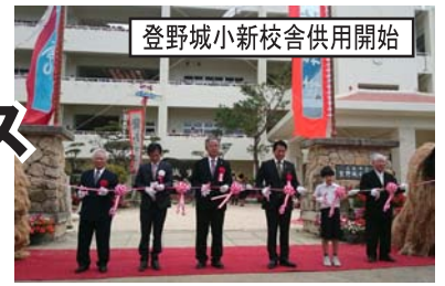
登野城小新校舎供用開始