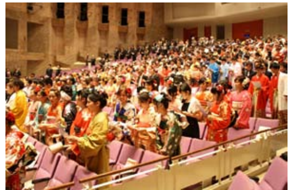
平成30年石垣市成人式の様子

※ なお、新成人者個人々々への案内状の発送等はいませんが、本市在住者や出身者及び本市に本籍のある方など、新成人者を全市民を挙げて祝う成人式としています。