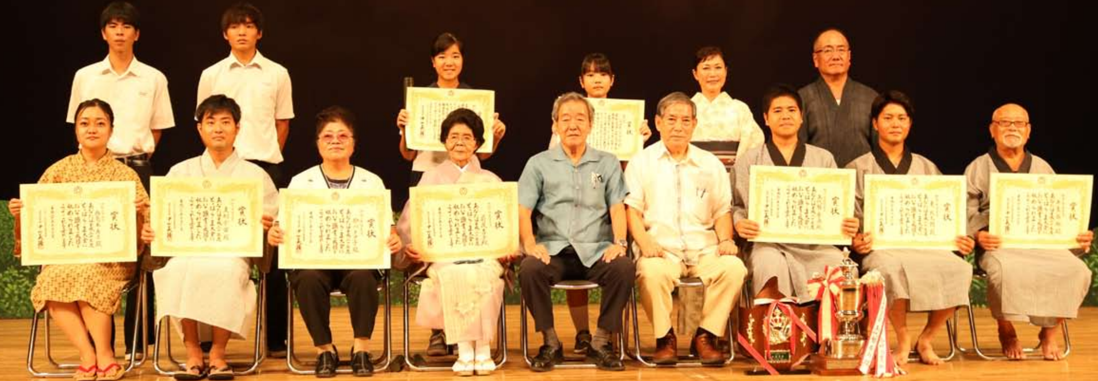
旧暦の8月13日にあたる9月22日、市民会館大ホールにて、第72回とうばら一ま大会が開催されました。