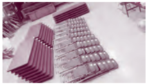
(真栄里自治公民館)