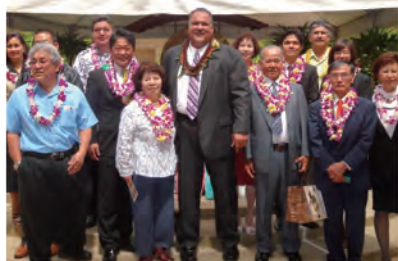
【写真上】平成25年にカウアイ郡で開催された議決50周年記念式典の様子。石垣市からカウアイ交流団「石垣市民の翼」のメンバーも参加しました。